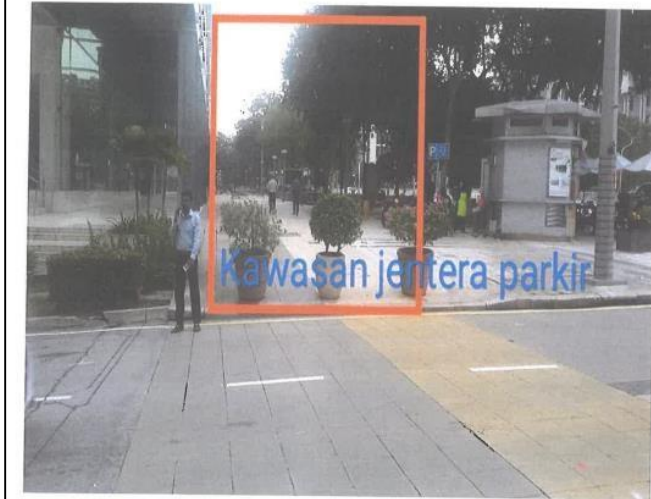
Contoh 4 : Gambar kerja yang menunjukkan dengan jelas kawasan yang terlibat beserta asset inventori sediaada di tapak.